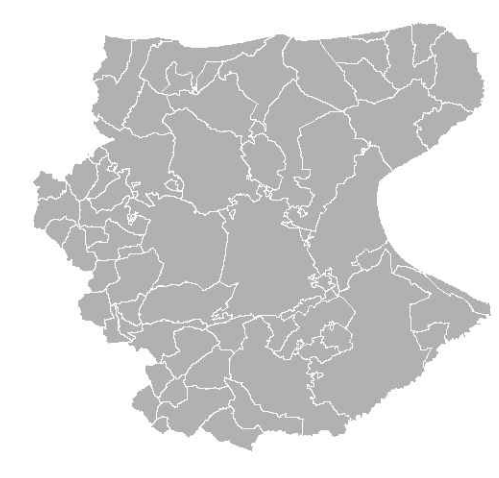
Tavola A2 Vulnerabilità degli acquiferi 1:130 000