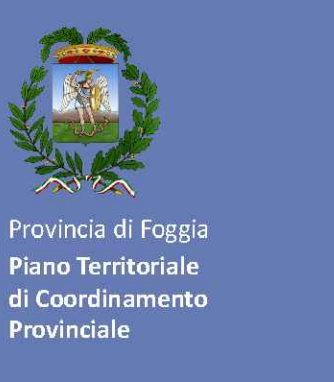
Tavola A2 Vulnerabilità degli acquiferi