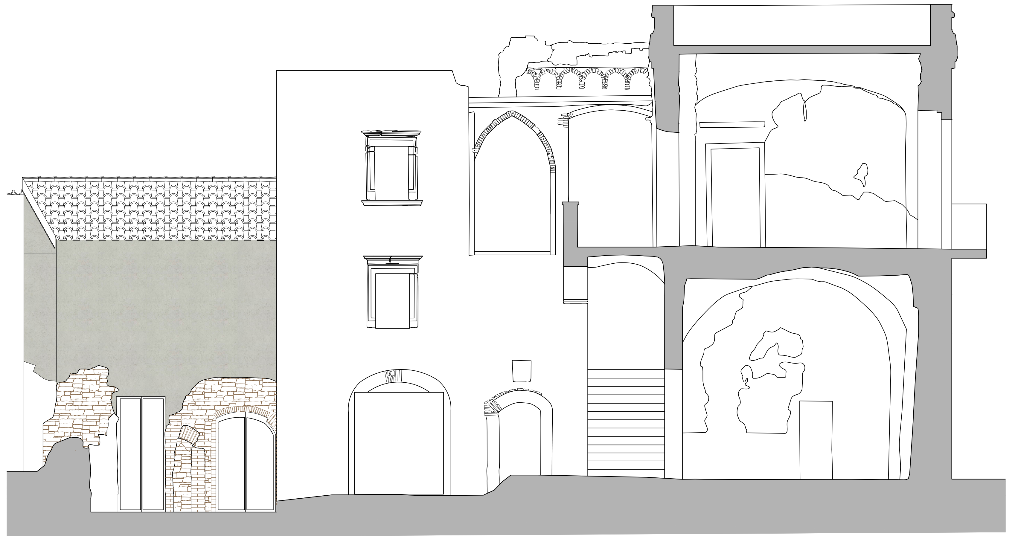
Simulazione tinteggiatura prospetto nord-est