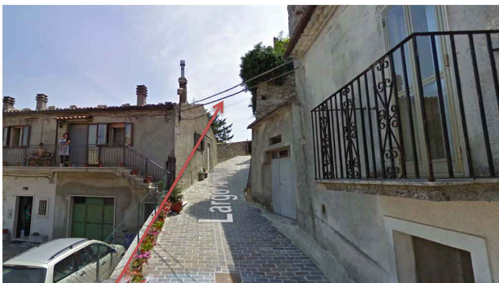
Accesso al Palazzo Ducale

Durante le lavorazioni, che dovessero richiedere l'impiego di mezzi meccanici con occupazione di strade pubbliche, si dovrà garantire l'accessibilità alle proprietà private limitrofe, secondo le esigenze dei proprietari, nonché la parziale agibilità della viabilità, ove possibile, mediante un sistema di traffico alternato regolato da impianto semaforico provvisorio o mediante movieri a terra.