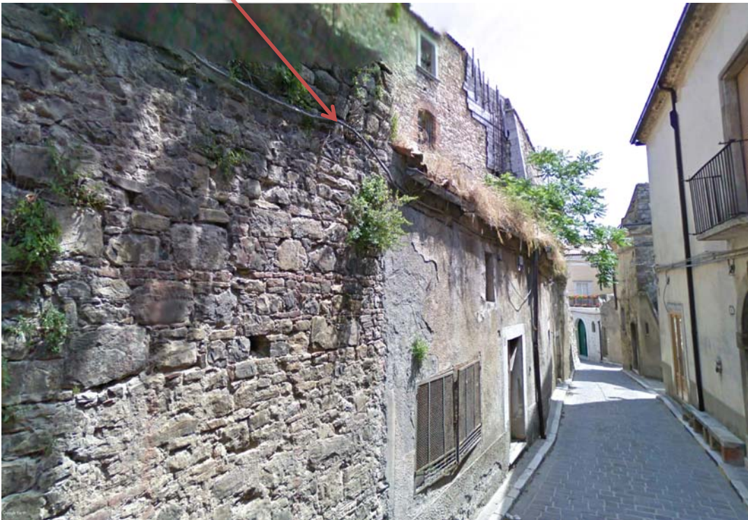
Fabbricato da demolire lungo c.so Garibaldi

Presenza linee aeree ENEL - P.I. - TELEFONICHE