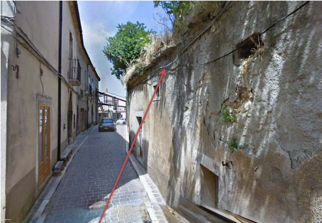
Fabbricato da demolire lungo c.so Garibaldi

Presenza linee aeree ENEL - P.I. - TELEFONICHE